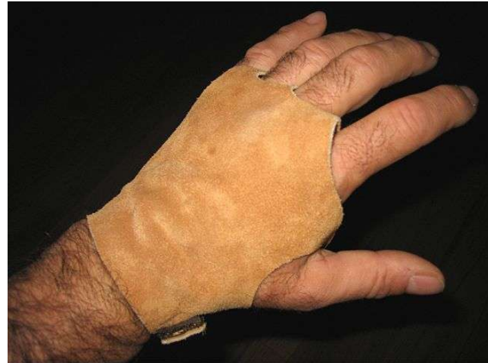
Mano protegida por el dorso