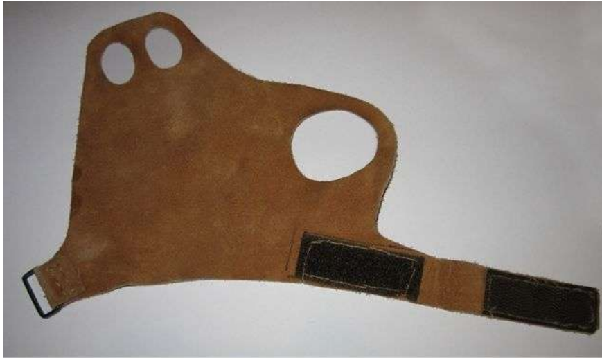
Guante de protección del dorso de la mano para escalar fisuras

Utiliza la plantilla de la segunda página para recortar el guante en un trozo de badana (mejor fina, pero fuerte). Luego coser como mejor puedas las dos piezas de velcro como se indica en la figura, adaptándola a la medida de tu mano. Las medidas son a escala natural para una mano de tamaño medio. Si tienes la mano más grande tendrás que aumentarlas un poco a ojo.