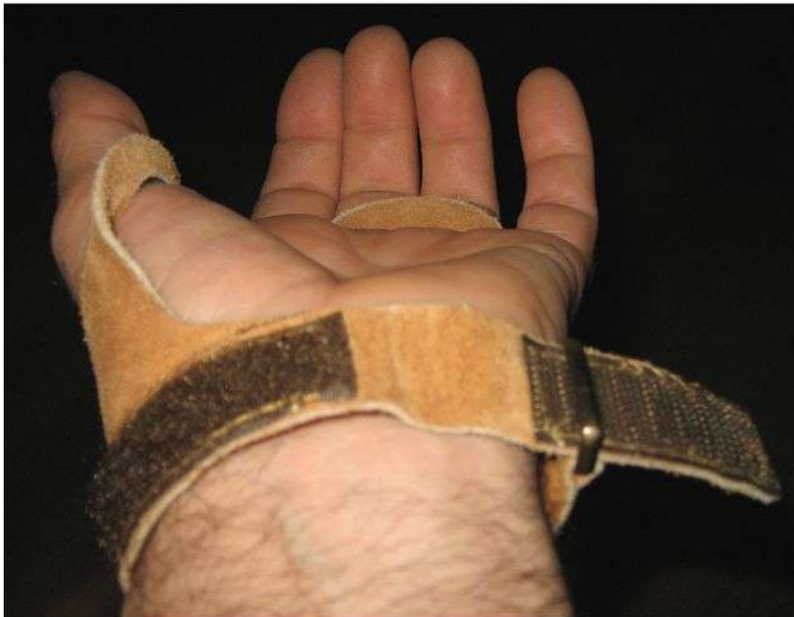
Sistema de sujeción a la muñeca mediante velcro