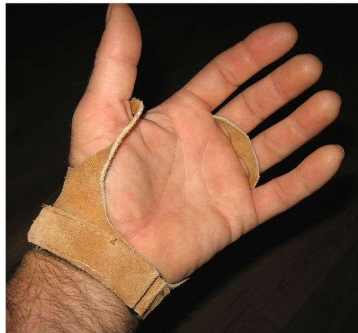
Mano libre por la palma